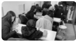
前橋敷島での授業風景