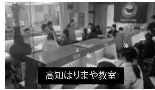
高知はりまや教室